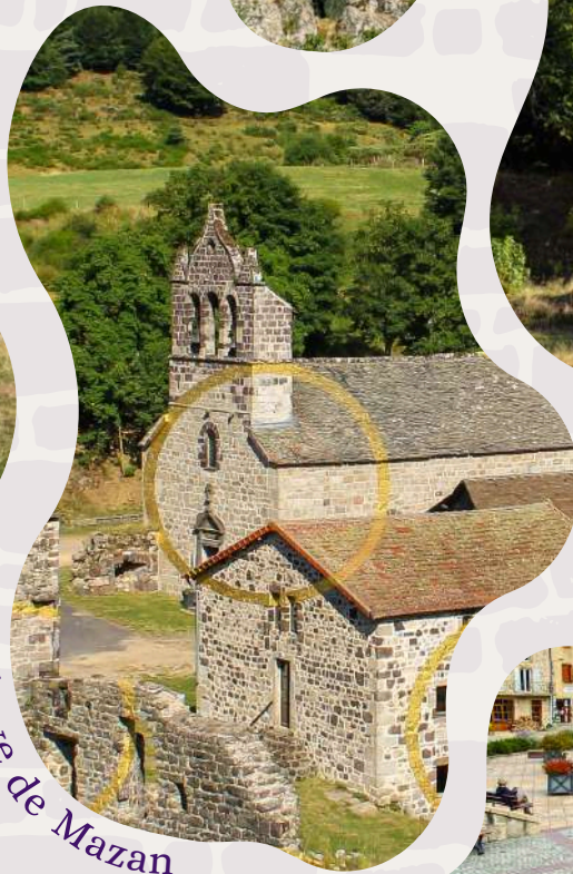
Abbaye de Mazan