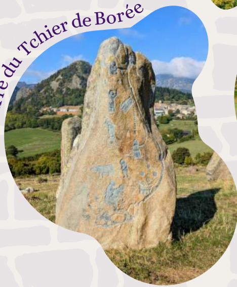
Erre du Tchier de Borée